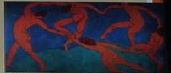
Dancers by Vincent van Gogh

"Great art... great music... a great interactive experience."