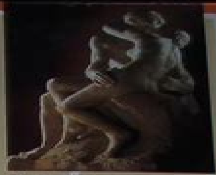
The Seated Figure by Michelangelo