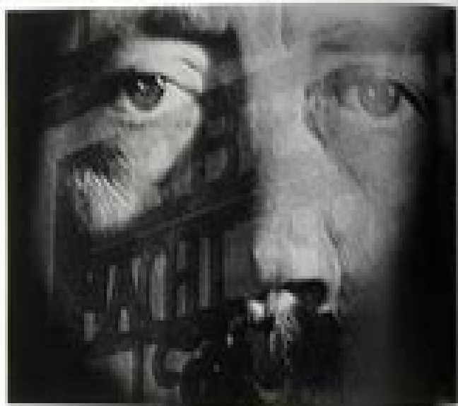
Portrait of a Man